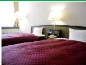
ゆったりとした広さ (28㎡) ツインルーム