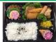
朝食はスポーツ弁当になります。