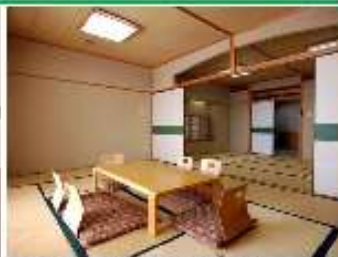
畳の心地よい書りで癒される広々な和空間