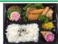
朝食はスポーツ弁当になります。