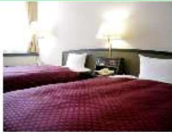
ゆったりとした広さ (28㎡) ツインルーム