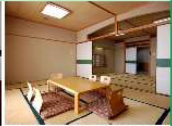
畳の心地よい書りで癒される広々な和空間