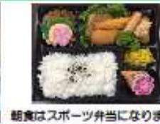
朝食はスポーツ弁当になります。